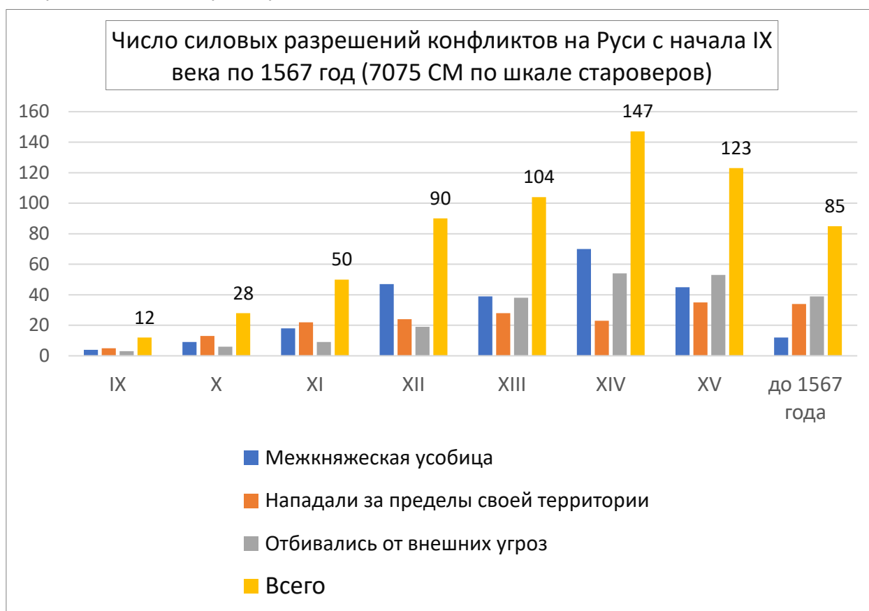
Рис. 2. Статистика силовых разрешений конфликтов на Руси по 1567 год (по данным ЛЛС и Никоновской летописи)

Собственно, почти за восемь столетий из 639 стычек в Древней Руси оборонительный характер имели только 35%: