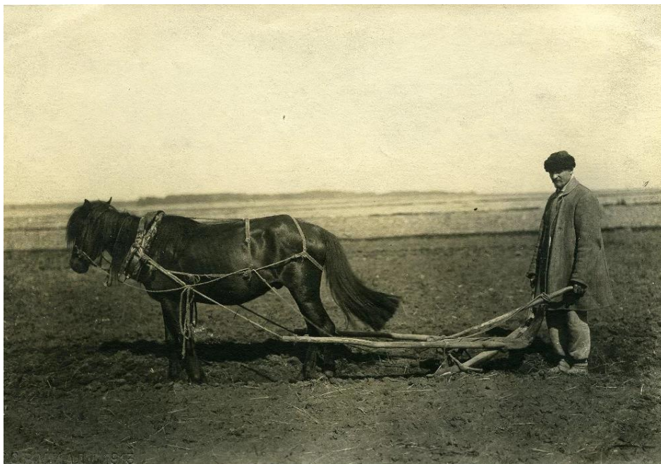
Рис. 4. Сталин принял страну с сохой, оставил с ядерной бомбой...

Ну а теперь просто прикинем (учтя вот эту веб-информацию-«ликбез» >): одна полудохлая лошадь часто была просто не в состоянии тащить плуг, в том числе и поэтому использовалась для вспашки земли соха.