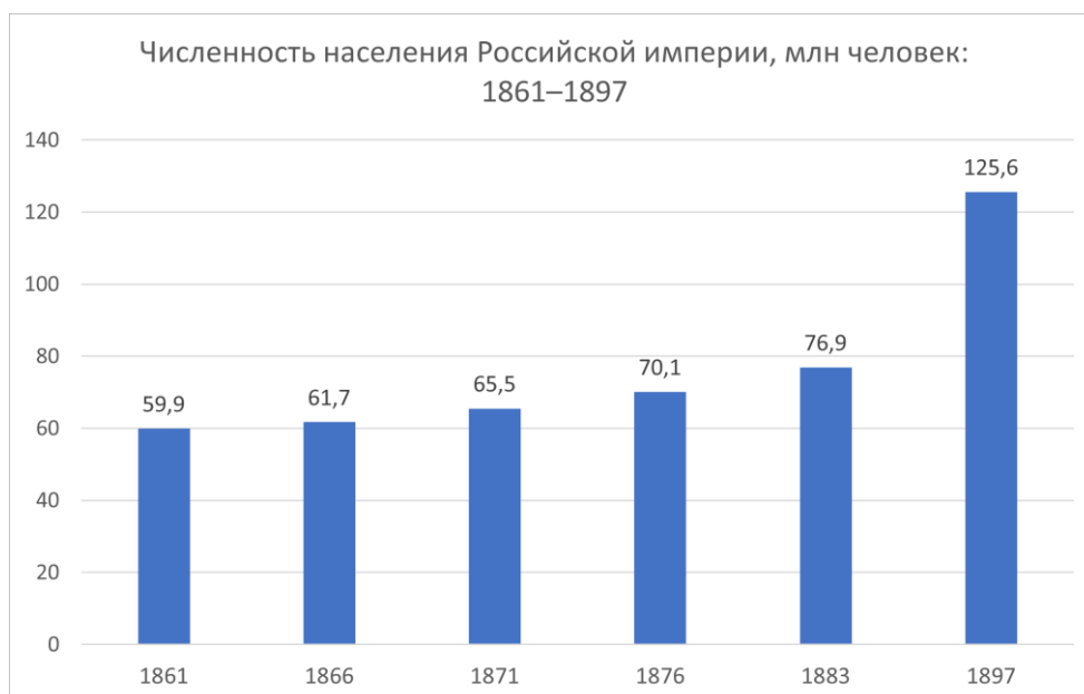
Рис. 2. А.В. Островский. Россия. Динамика численности населения с 1861 по 1897 год.

Динамика численности населения с 1861 по 1897 год впечатляет, она представлена диаграммой, отстроенной по данным Островского.