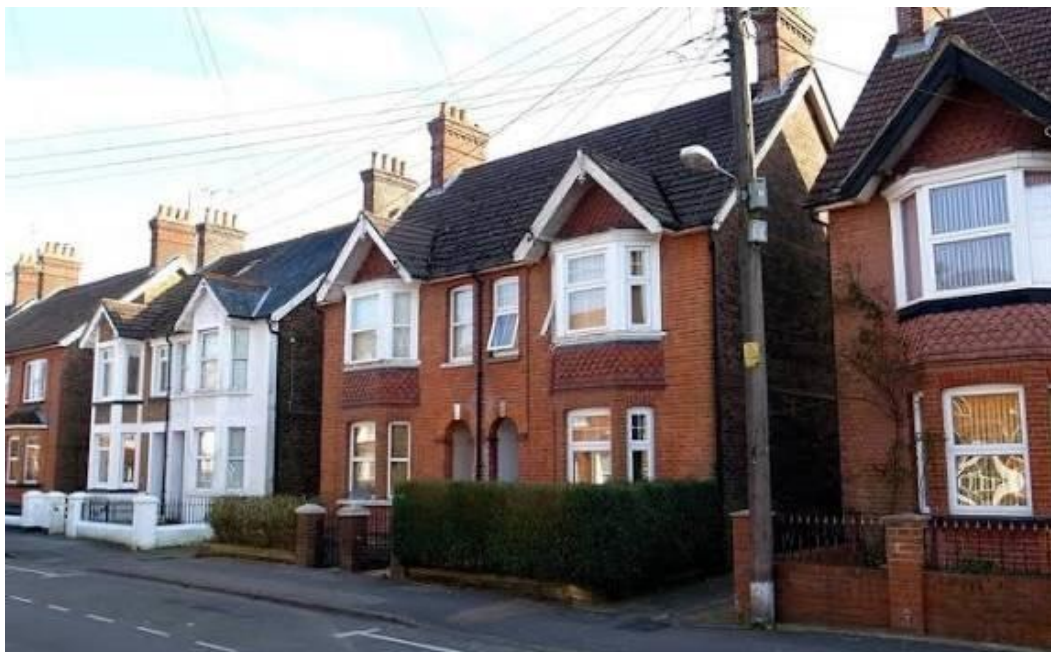
Рис. 3. Лондонская недвижимая идиллия

То есть власти РФ века XXI своими же руками превратили своё окружение в сообщество вечного дефицита личностей с умом, опытом и волей.