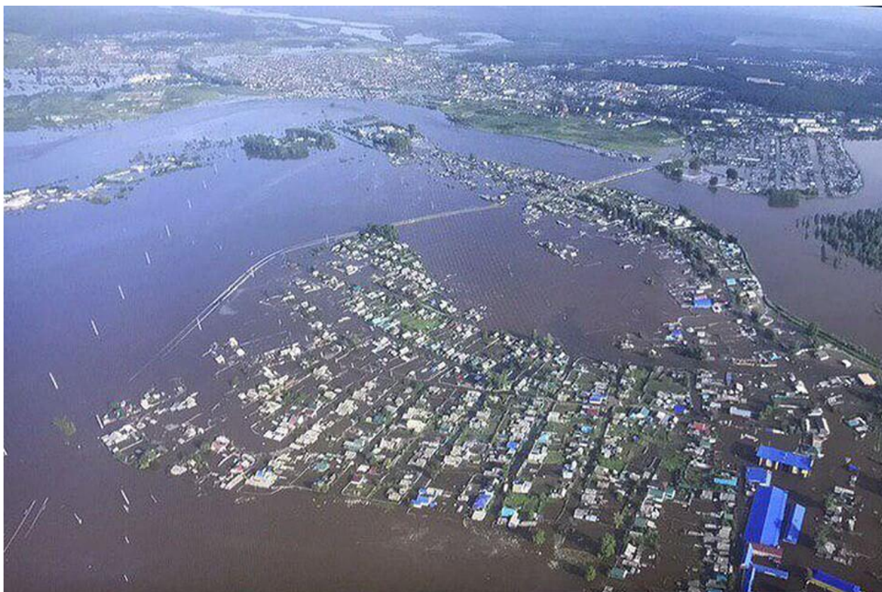
Рис. 4. Наводнение в Тулуна (Иркутская область), 2019 год.

Да, конечно же пострадавшим от весеннего наводнения и в Дагестане и в Чечне оказывается и далее будет оказана вся возможная помощь. Люди не останутся в беде!