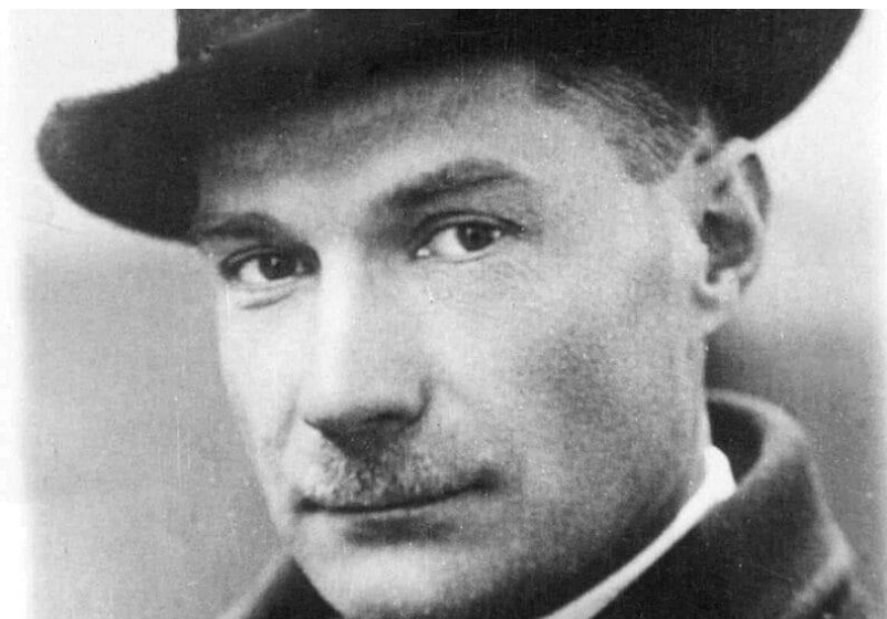
Рис. 1. Евгений Иванович Замятин.

Однако были времена, когда мировое признание не «забывало» русское авторство той или иной идеи. Так сын священника, кораблестроитель по образованию, свидетель восстания на броненосце «Потёмкин» Е.И. Замятин (†1937, Париж) после выхода в свет своего романа «Мы» в 1920 году по праву стал считаться «отцом» литературного жанра антиутопии .