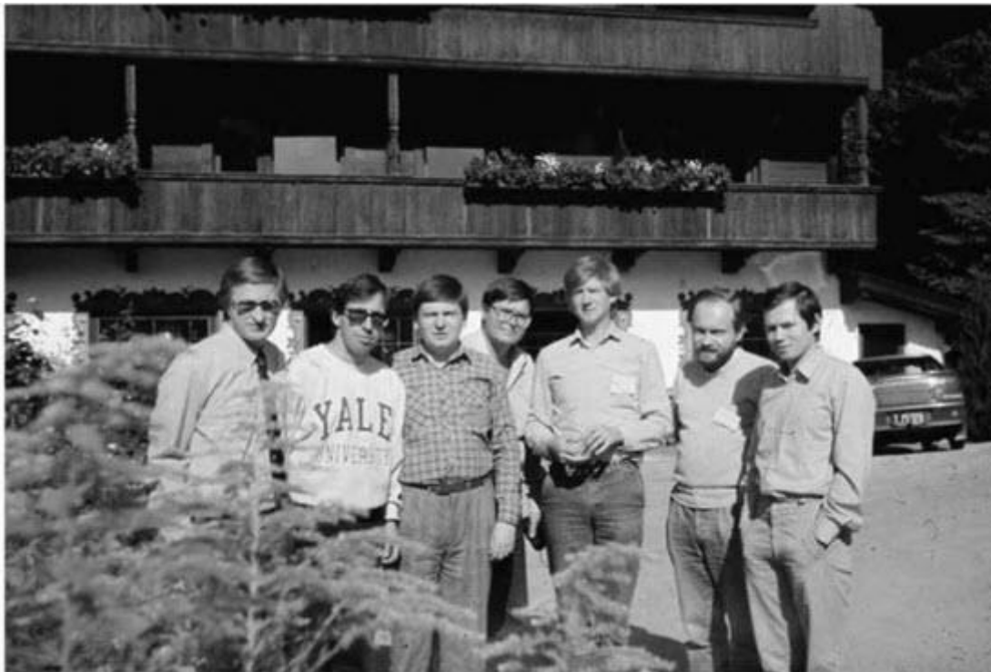
Рис. 2. Весна 1991. Младореформаторы на «курсах» в Австрии.

Конечно же это «Профсоюз олигархов» (РСПП) с несменяемым г-ном Шохиным во главе. — Узнаёте ли вы его лик на спецкурсах в Австрии (рис. 2), понятно кем и для чего организованных? И понятно ли кем в Питере отобранных?