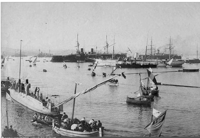
Рис. 1. Русская эскадра в Тулоне (под командованием контр-адмирала Ф. К. Авелана), с 13 по 29 октября 1893 года.

И, наконец, легко разглядев в псевдо-патриотической оргии будущий стандарт Оруэлла — «Знать и не знать, владеть полной правдой и говорить тщательно сфабрикованную ложь, придерживаться одновременно двух взаимоисключающих мнений, знать, что они противоречат одно другому, и верить в оба...» — Толстого прорвало: