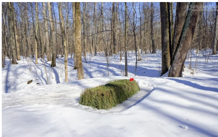
Рис. 3. Ясная Поляна. Тульская область. Могила Л.Н. Толстого

Последними словами гения нации были: «Мне хочется, чтобы мне никто не надоедал... я люблю много, я люблю всех...»