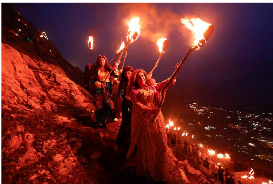
Рис. 5. Новруз в Иране, 2023 год.

С точки зрения астрономов, весеннее равноденствие происходит в момент, когда ось Земли оказывается перпендикулярной плоскости её орбиты вокруг Солнца. 20 марта 2026 года этот момент наступит в 17:45:14 по Москве.