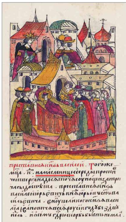
Рис. 2. Лицевой летописный свод царя Ивана IV Грозного. Книга 23, под 7068 (1568) годом от СМ. Скрин автора. Слово подчёркнуто мною.

«В том же месяце в 20 день на Масленицу, со среды на четверг...».