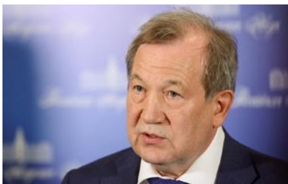
Рис. 4. Президент РАН Г.Я. Красников (с 2022 года).

Похоже, что именно этот персонаж (разумеется, не без поддержки г-на Гундяева) сбил с панталыку Президента РФ, который (на мой взгляд) принял ошибочное решение за счёт налогов всех граждан России заняться спонсорством глубоко враждебного нашей стране сообщества монахов Греции (к нашей древней вере не имеющих никакого отношения!). Их предки, после того как в 1182 году вырезали 60 тысяч (sic!) христиан ромеев-ариан в Константинополе, в 1204 году с трясущимися поджилками бежали в горы Афона от гнева дуче Энрико Дандоло, пытаясь соскрести из своей памяти также и 218-летний период «ига» Руси над Грецией ; ныне их потомки, персонажи-в-рясах, не забыв ничего, спонсируют украицистов, о чём подробнее говорится в статье «Россия и Афон...» . — Зазеркалье!