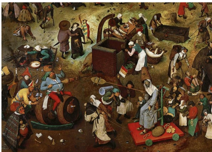
Рис. 6. «Битва Масленицы и Поста» — картина Питера Брейгеля Старшего (1559). Фрагмент.

Их реакцию на тесное соседство Масленицы и еврейских «заморочек» наглядно отобразил Питер Брейгель Старший (1559) на картине с характерным названием «Битва Масленицы и Поста»: