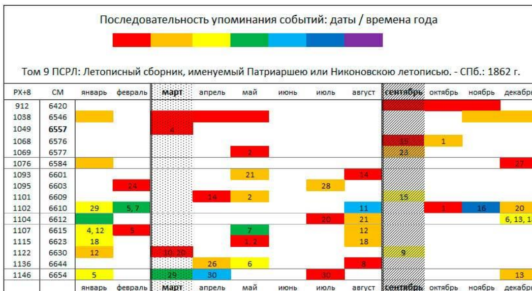
Рис. 1. Матрица летописных дат и последовательности упоминаний месяцев на протяжении одного и того же года по Патриаршей (Никоновской) летописи.

Вплоть до 6557 года СМ Национальная летопись России — и можно взять любую её версию из состава ПСРЛ — никакой системы в определении даты начала Нового года в явном виде не демонстрирует. Начиная по-годовые записи со слов, например, «В лето 6370...» (год прихода братьев Рюрика, Синеуса и Тривора на Русь), монахи далее не приводили ни одной даты, и ни одного климатического описания в тексте!