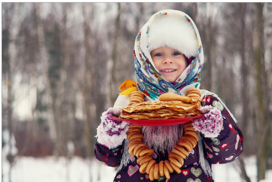
Рис. 3. Масленица на Руси

При всём при том, и как говорят на Руси, «к бабке не ходи» — функционеры РПЦ точно не готовы даже и сегодня ответить на элементарный вопрос: по какой такой причине в нашей стране Луна и её циклы стали почитаться больше, чем Солнце и земной круговорот вокруг него? Или русские блины да баранки Луну символизируют (рис. 3)?