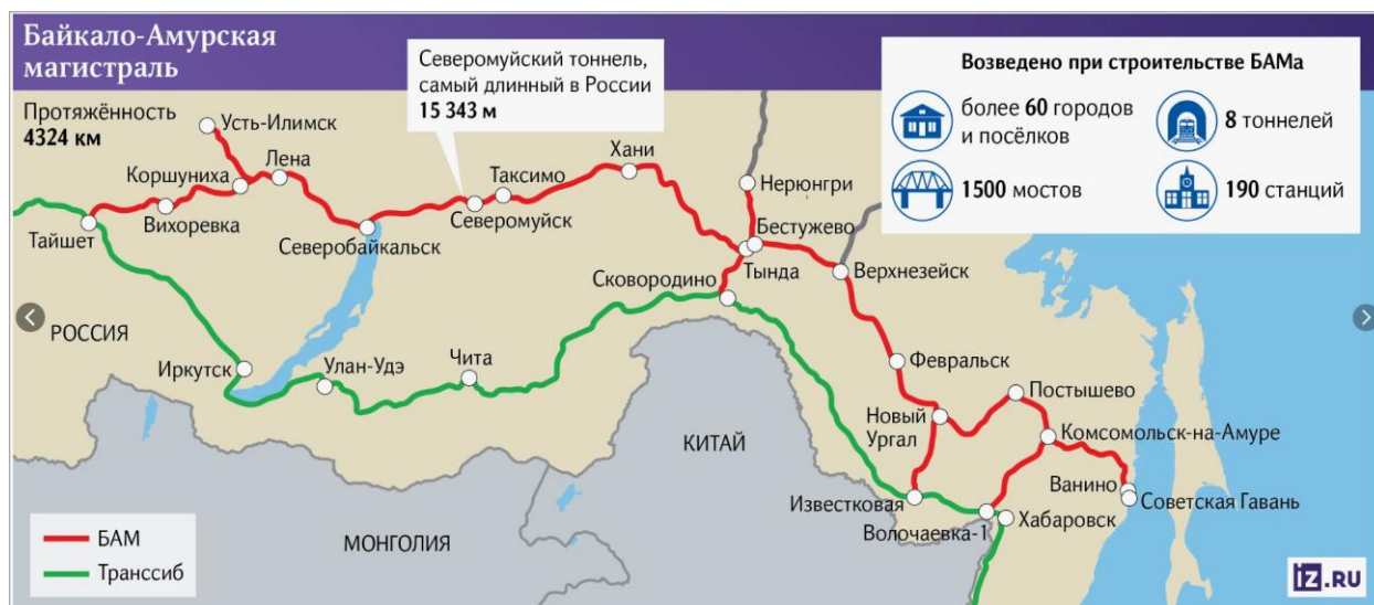
Рис. 2. Байкало-Амурская магистраль и Транссиб.

1. Идея БАМа как дублёра Транссиба была рождена ещё в 1888 году, но проект положили на полку из-за сложности воплощения; первые строительные работы — в 1932 году силами узников ГУЛАГа.