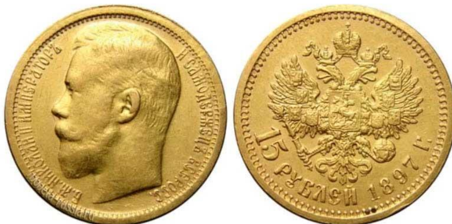
Рис. 1. 15 рублей 1897 года (Империял), чеканился только в 1897 году, https://yandex.ru/images/search?text=Империял%201897&source=related-duck&lr=213&from=tabbar&pos=2&rpt=simage&img_url=http%3A%2F%2Fic.pics.livejournal.com%2Fclio_historia%2F86301992%2F7977863%2F7977863_original.png

содержанием 7,74 г чистого золота (против 8,6026 г прежде, расчётом)... Практика государственного фальшивомонетничества, «денежных игр» от царя Алексея Романова (помним Медный бунт?) в Российской Империи неистребима!