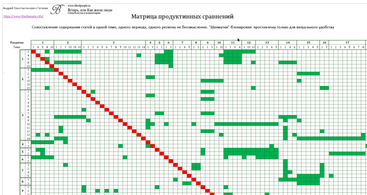
Рис. 4. Фрагмент Матрицы продуктивных сравнений; полная версия — в свободном доступе в Облаке: https://cloud.mail.ru/public/uzfR/nW5G4Y6L7

В проекте такой Матрицы представлены тематические шифры, используемые на Сайте : например, «1.8» — это шифр темы « Погода, гео- и климатические катаклизмы » в разделе №1 « Природный окоём. Человек ». Понятно, что природный окоём и выбор мест проживания связаны накрепко, и также крепко, как и с вопросами пошива одежды (шифры «6.1 и 6.3»), с промыслами («11.1–11.3») etc.! Если же баланс событий и описаний меж всеми связанными темами не сходится ( см. ещё пример > ), то очевидно, что перед нами ложь!