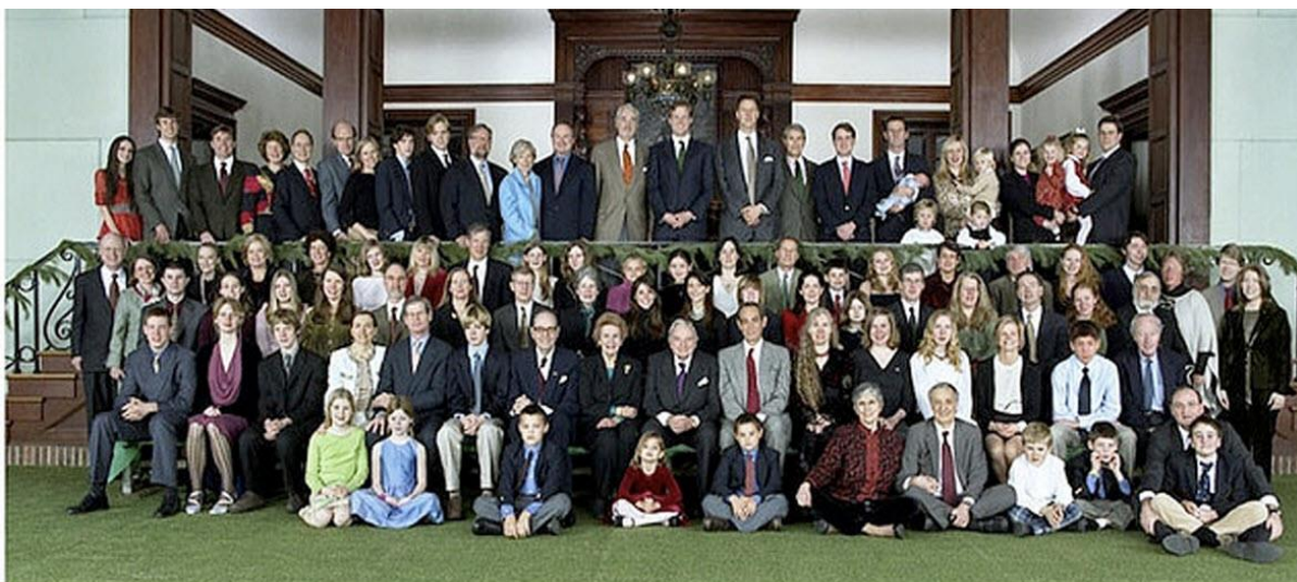
Рис 1. Семья Рокфеллеров.

Напрасно думать, что где-то существуют протоколы заседаний лидеров Матрицы, и что имеется её списочный состав. Окститесь! — А зачем, если все действия и противодействия здравому смыслу уже давным-давно прописаны среди их сообщества, и каждому «сверчку уже уготован свой шесток в Сети». И попробуй, попав в этот круг, хоть что сказать вопреки?!