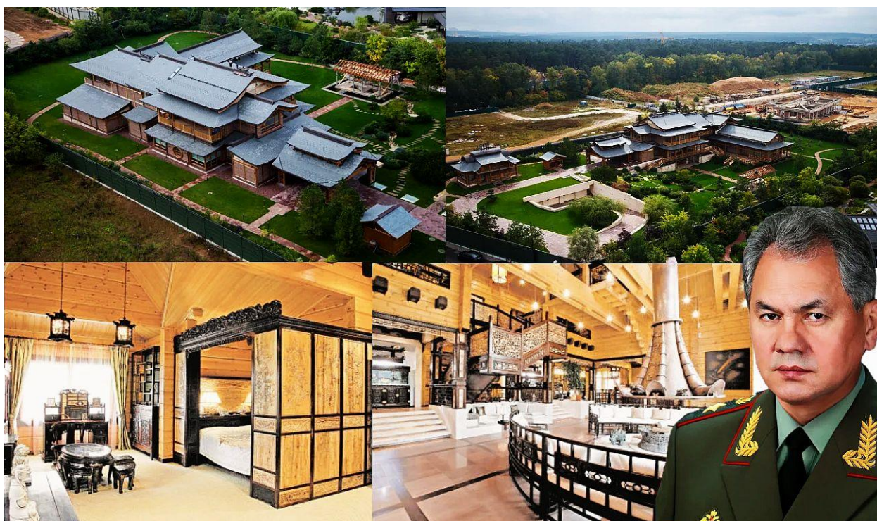
Фазенда Шойгу в Барвихе. В подражание Рокфеллерам.

Не приводя никаких напраслин, просто приведу фото «буддийской фазенды» бывшего старлея-пожарника, ставшего стараниями Ельцина сразу генералом, но лишь в апреле 2025 года выведенного (и что характерно!) вместе с Чубайсом из состава Попечительского совета Центра Ельцина в Екатеринбурге.