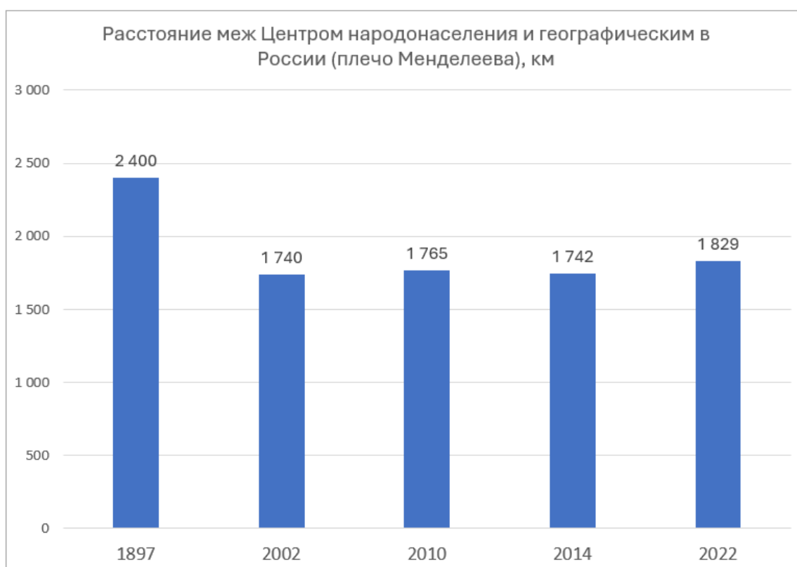
Рис. 2. Динамика изменения плеча Менделеева в России.

По состоянию на 2014 год на карте показано смещение двух Центров в современной России (красные кружки) по отношению к плечу Менделеева в Империи (синяя стрелка) — идём в Азию!