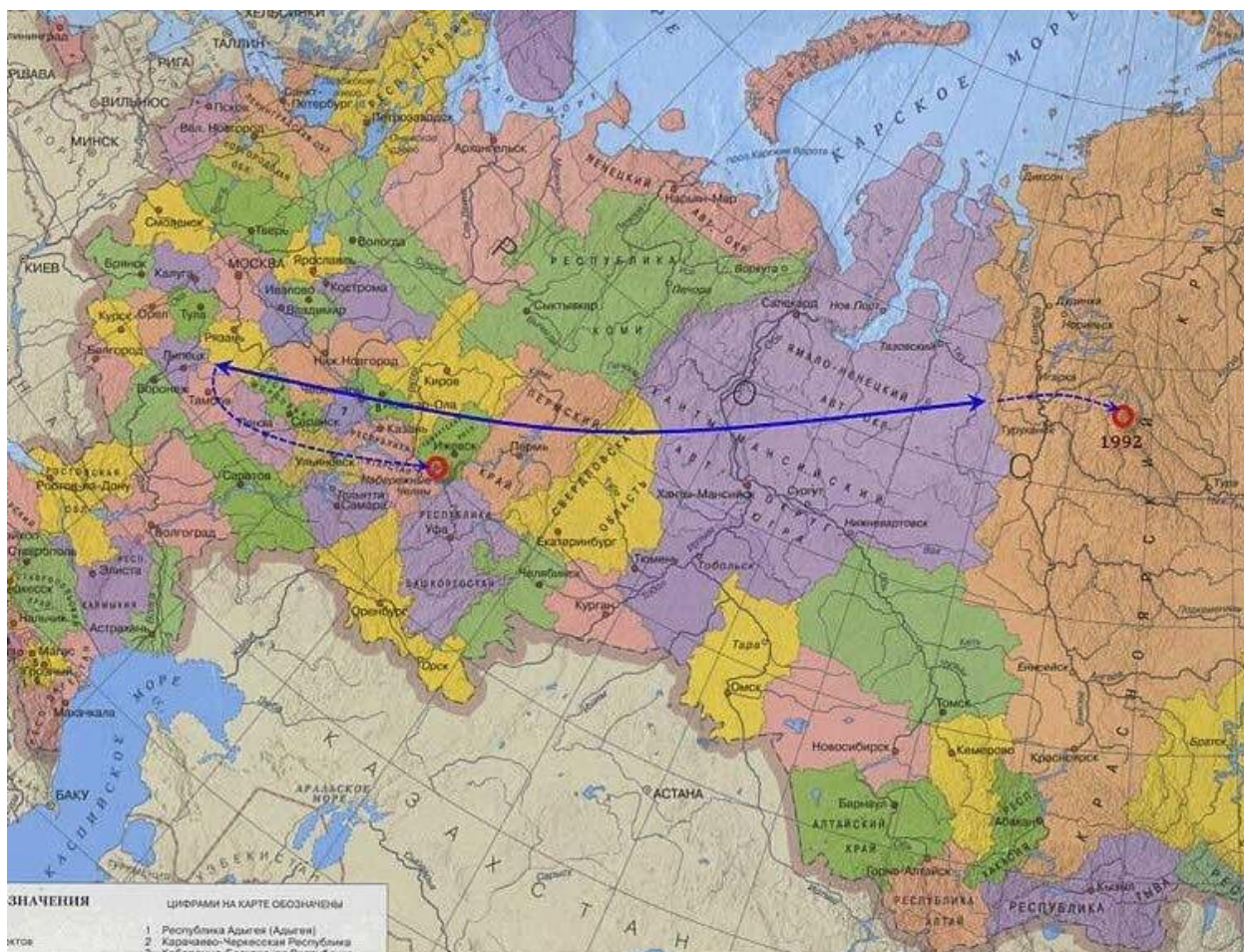
Рис. 3. Смещение центров народонаселения и географического РФ в 2012 против 1897 г., https://www.lifeofpeople.info/themes/?theme=2.3.21.s

Центр народонаселения на 2014 г. находился окрест Ижевска, а географический — у озера Виви: это от Красноярска к северу, почти строго по меридиану — в точке 66^{\circ}25' N и 97^{\circ}03' E — см. здесь >>