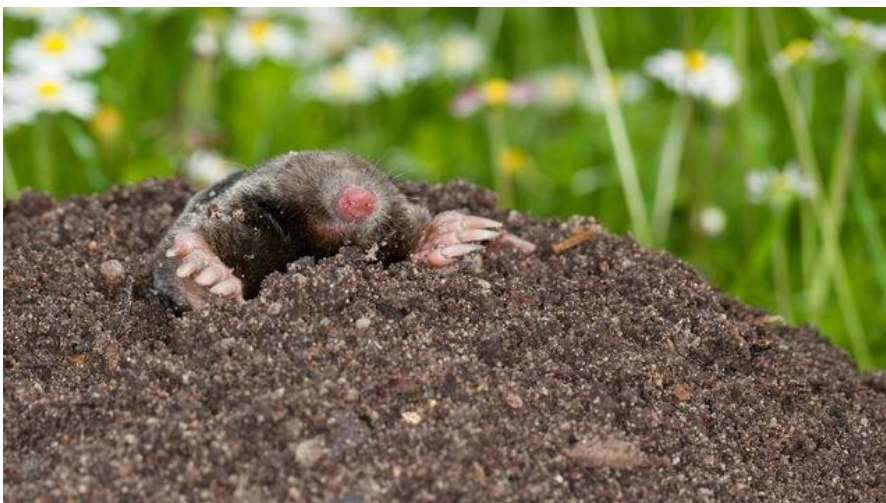
Рис. 1. Крот.

Учёные, как и персонал отдельных нормотворческих и управленческих Центров — это (образно) «кроты», каждый из которых истово роет свою «ямку», часто даже не желая знать, чем занимается сосед, профи в иной науке (/области управления). Ситуация в последнее время меняется, но крайне медленно.