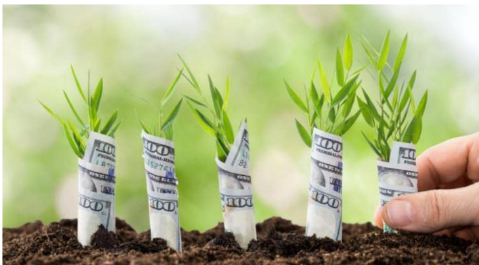
Рис. 3. «Посадочные работы» Минфина и Центробанка РФ.

Мало кто догадывается, что не только Бэбсон подглядывал за успехами физики, но и сам Фишер свою центральную идею умыкнул у Бенуа Клапейрона, у физика опять-таки. Причём, в отличие от Бэбсона, умыкнул молча >>