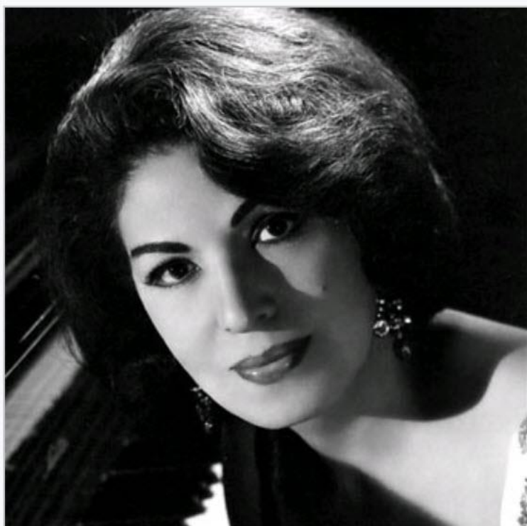
Консуэло Веласкес

О Консуэло Веласкес Торрес (†2005) говорить можно только в восторженных тонах. В свои 16 лет (в 1932 году) она создала неувядаемый шлягер Всея Мира – Bésame Mucho («Целуй меня страстно»), особое «лакомство» аранжировщиков. Природная пассионарность привела её поначалу в ряды активистов защиты авторских прав, а затем и к вице-президентству в профильной Всемирной гильдии. В этой должности, никогда прежде не занимаемой женщиной, она энергично взялась за борьбу с пиратством.