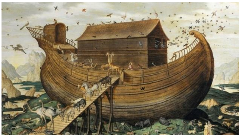
Рис. 1 Ковчег Ноя, https://akcenty.com.ua/images/2019/04/21/Lc9aNJldSuyTrX166DVqIFnjRT1dBUin.jpg

непонятно сколько именно бактерий, ибо их описание пока застопорилось окрест цифры 10 000.