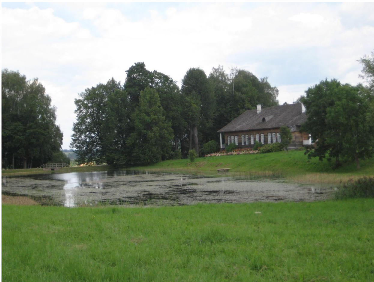
Рис. 2. Усадьба «Тригорское», 2016.

Звучит фантастикой информация о библиотеке начала XIX в усадьбе Тригорское, куда частенько заглядывал Пушкин.