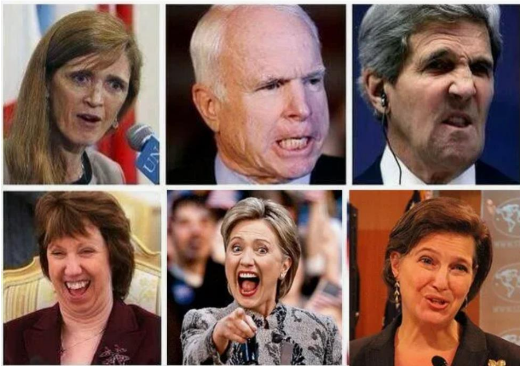
Рис. 3. Представители «исключительной нации, избранные: https://sun9-18.userapi.com/impf/c626525/v626525426/417c4/C6o5SD6bzwo.jpg?size=599x447&quality=96&sign=2df6790fca7f3ed3164cfeaf17cb367a&c_uniq_tag=8Kb3j7wfTwXwtn2O8Rpgl2H5XfueyjjHbBlspG5Jwqw&type=album

И Бог-Отец Иегова воздал, осчастливив героиню диалога с «к.п.д.» в виде сына Овида, деда будущего царя Давида... Сегодня общество вынуждено уже в законодательном порядке вводить юридическую норму привлечения к суду детей за неказание ими помощи престарелым родителям. И вот они, проводники этих идей — (жуть! Ну и рожи! А ведь это некогда считаемые Кремлём «наши партнёры»!):