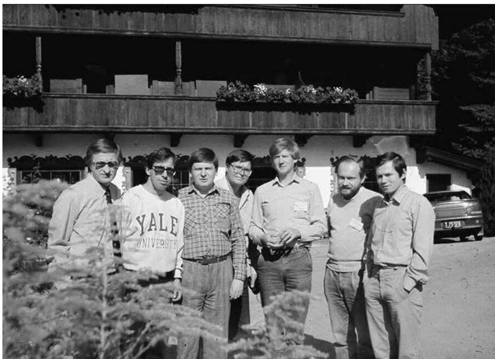
Рис. 4. Знакомые всё лица: младореформаторы на спецкурсах в Австрии, https://avatars.mds.yandex.net/get-pdb/1054037/1ad77cdc-44ca-41c4-966f-fff8f589489c/s1200?webp=false

Или мы так и не оценили старания вот этих «мальчиков-терминаторов», некогда прошедших спецкурсы США в Австрии, и некоторые из которых правят Россией и по сей день, находясь в ближнем круге лидера нации?