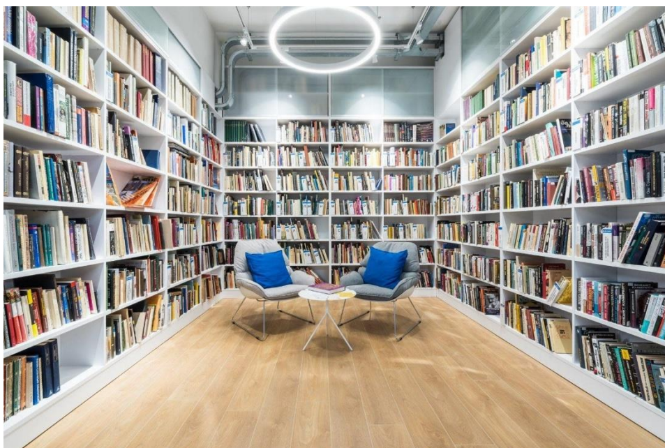
Рис. 1. Современная библиотека, Яндекс. Картинки

Гилберт удачно сформулировал фразу, из которой следует, что существует, на самом деле, лишь несколько книг в мире, после прочтения которых читать иные книги нет смысла. По большому счёту, в политике и идеологии их, базовых книг, на мой взгляд, и всего-то четыре, в которых описано всё то, что делать в достижении Добра нельзя категорически.