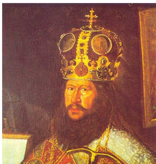
Рис.1. Патриарх Никон, †1681, http://www.podelise.ru/tw_files/24707/d-24706304/7z-docs/1_html_16e36174.png

Разбушевался второй дуумвират лидеров Власти и Церкви не на шутку!