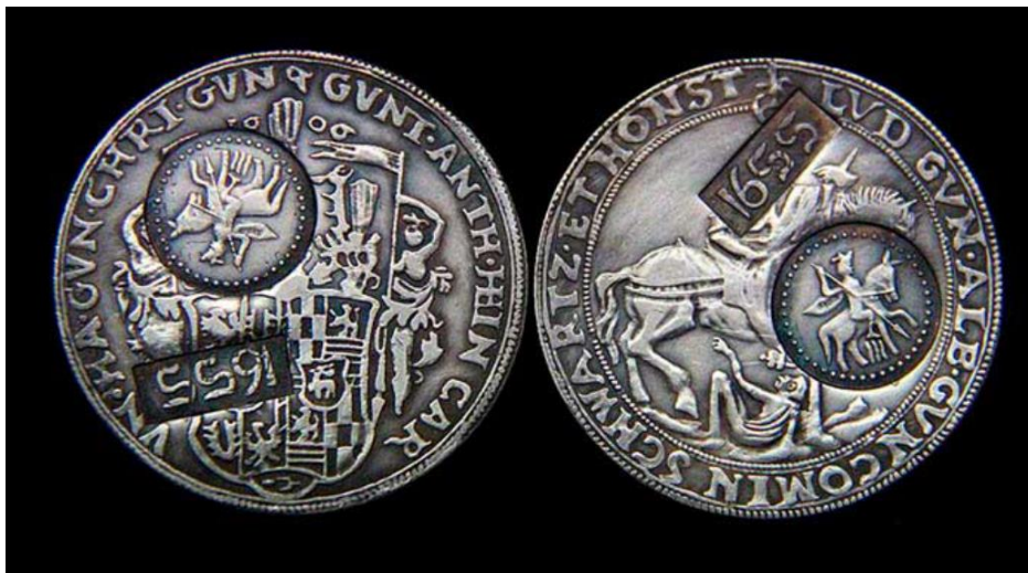
Рис. 1. Ефимки царя Алексея Михайловича с надчеканками на талерах, https://im4.kommersant.ru/Issues.photo/MONEY/2016/036/КМО_090981_07999_1_t218_165935.jpg

Дополнительно замечу важное: Россия вплоть до времён Петра испытывала острейший дефицит в драг- и цветных металлах. И поскольку в стране ни своего серебра, ни золота, ни меди не было вообще, монетная инвалюта от экспорта (талеры, доллары Голландии, драхмы и проч.), вынужденно переплавлялась в серебряные «московки», а затем в копейки Елены Глинской, что были размером с ноготь мизинца, или же надчеканивались — получались ефимки :