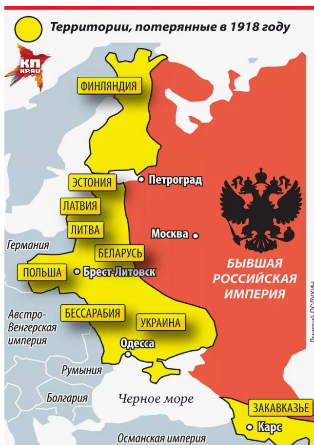
Рис. 1.

Весьма примечателен перечень стран, практически мгновенно признавших итоги Киевского военного переворота 1918 года, устроенного генерал-лейтенантом Русской императорской армии Павлом П. Скоропадским в целях, в том числе, «застолбить» положения Брестского договора — это Германия, Австрия, Турция, Болгария, Грузия, Финляндия и Польша. Надо отдать должное этим странам: они весьма последовательны в своих русофобских предпочтениях. Но какова дырявость памяти России о том!