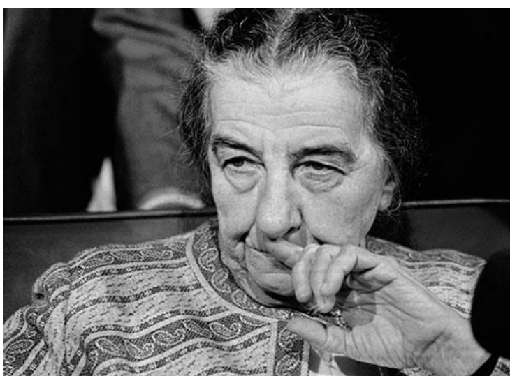
Рис. 3. Голда Меир (Меерсон)

И вот евреи-демонстранты, свезённые со всех уголков России и не только (на какие деньги? откуда такая высокая синхронизация действия? и откуда такая скорость?), впав в экстаз радости от замаячившего переселения на новую Землю обетованную, устроили в столице бузу. — Вот насколько эффективно могут работать исторические мифы и персонал лишь одной синагоги! Разумеется, «майданутых» быстро поставили на место.