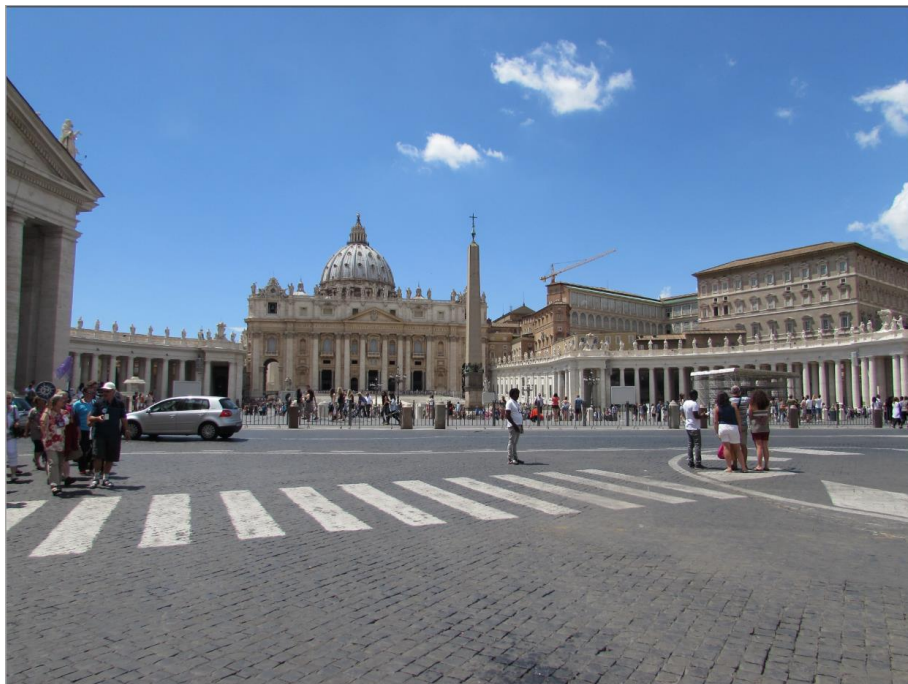
Рис. 3. Ватикан. Собор Святого Петра и площадь перед базиликой, https://upload.wikimedia.org/wikipedia/commons/1/13/Piazza_San_Pietro_din_Roma21.jpg

Речь идёт о «космической силе» влияния архитектурного ансамбля на умы европейцев, и который возводился силами и на деньги всех католиков Европы на протяжении аж 1500 лет при участии многих гениев Средневековья (Рафаэля, Микеланджело, Браманте...):