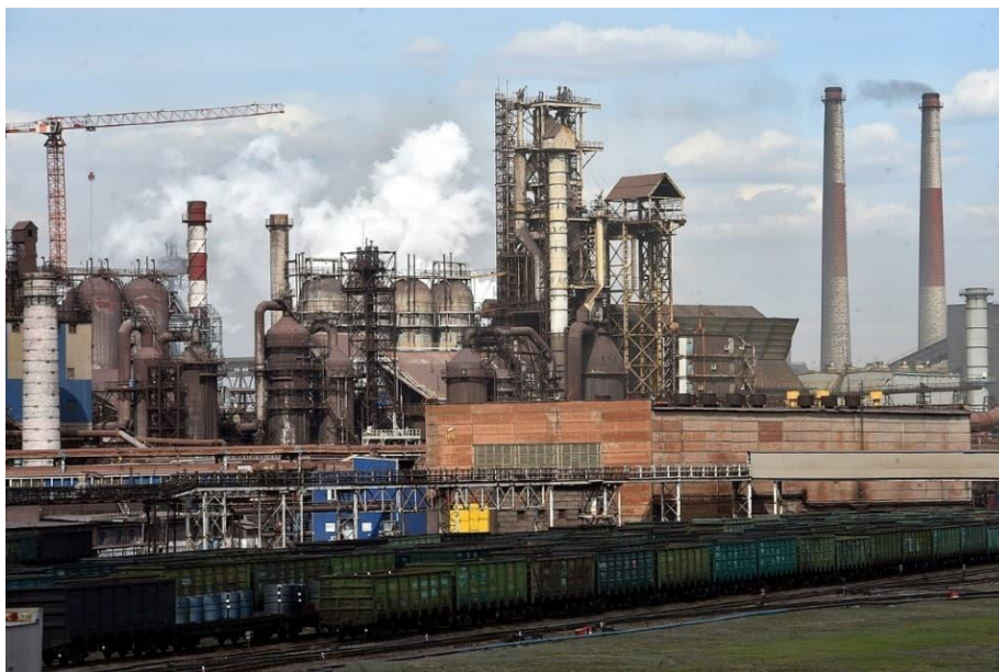
Рис. 1. ММК в наши дни

Иностранных инженеров-специалистов, например, на строительстве Магнитогорского металлургического комбината насчитывалось до 250 человек. Американец Джон Скотт как раз там и стал одним из рабочих, оттрудившись у нас с 1933 по 1937 год и оказавшись одним из немногих, кто оставил объёмные воспоминания >>