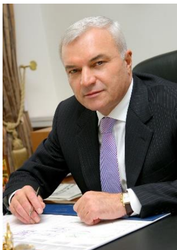
Рис. 2. Виктор Филиппович Рашников

Думаю, что Джон Скотт сегодня впал бы в кому, посмотрев на авуары современных российских министров, управляющих и директоров . Тут произошли в России вообще невиданные ранее в мире нигде и никогда сдвиги!