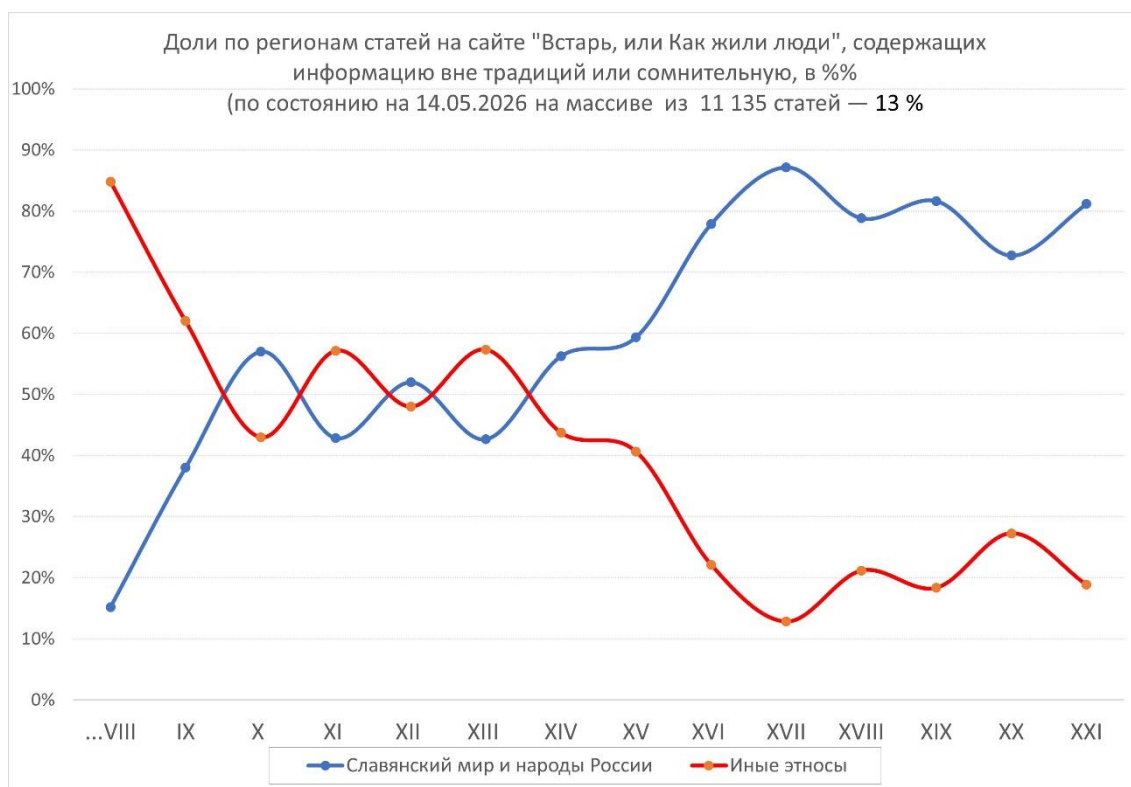
Рис. 1. Доля информации вне традиций или с откровенной ложью и (или) выдумками в литературных памятниках славянской суперэтносистеме составляет в среднем 13 %.

Надо сказать, что наша летописная история — это нечто! Благодаря стараниям РГКЦ (ныне РПЦ) и Дома Готторпов-Романовых фантом сидит на фантоме, погоняя фантомом! При описании событий в славянской суперэтносистеме доля лжи и (или) фантазий, начинаясь примерно с 10% в тематических фрагментах первоисточников для веков ранее VIII, доходит до 90 % в веке XIX, то есть до уровня сплошной «сказки» от Дома Романовых, сочинённой этим Домом в веках XVIII–XIX, и которая продолжает вдалбливаться в сознание граждан России её эрзац-идеологией. Крайне примечательно, что представленный на рис. 1 ход кривых, отражающих объёмы исторической лжи в исторических документах двух суперэтносистем, в точности повторяет итоги статистики от Питирима А. Сорокина — пассажира «философского парохода», основателя факультета социологии в Гарварде (1931) — по динамике изменения доли религиозных сюжетов в картинах художников по векам, и не только итоги данных Сорокина! ( подробнее см. здесь > или бесплатно, до 20.5.26 скачать в облаке > )!