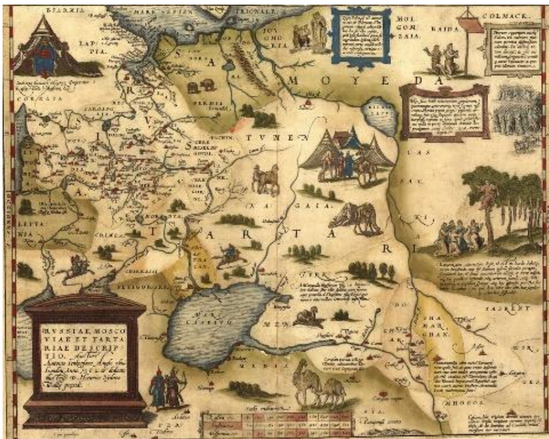
Рис. 4. Россия и Тартария, Карта 1562 года от Энтони Дженкинсона, http://www.lifeofpeople.info/LibraryLoanData/MapsLoan/1562_jenkinson2.jpg

Территория Причерноморья (от Карпат и восточнее) всегда была зоной Ада (в переводе от «Тартар» — бездны для титанов под царством Аида, греч. мифология), что и отражено во всех текстах Западной Европы, и на многочисленных старых картах: