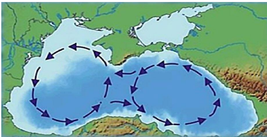
Рис. 3. Два водоворота в Чёрном море — «Очки Книповича»

Проплыть на тяжелых лодках-долблёнках триста миль по Дунаю (от Селистры), да с данью, а затем по Чёрному морю проблем для киевских морпехов не составило (sic!). Что логично указывает, что об «Очках Книповича» (рис. 3) попы, разумеется, даже и не догадывались в своих фантазиях. А ведь речь идёт о встречном течении Чёрного моря примерно в 5 км/час, которое нужно было на вёслах преодолевать на протяжении около 900 км от устья Дуная до устья Днепра; такая же примерно скорость и течения самого Днепра.