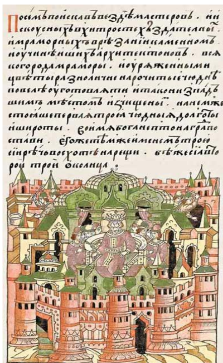
Рис. 2. ЛЛС. Новая Троя царя Приама. Описание крепости и города. Фрагмент 1

Ни до основания Трои, ни после — нигде не было создано такого величественного и настолько красивого города или подобного ему.