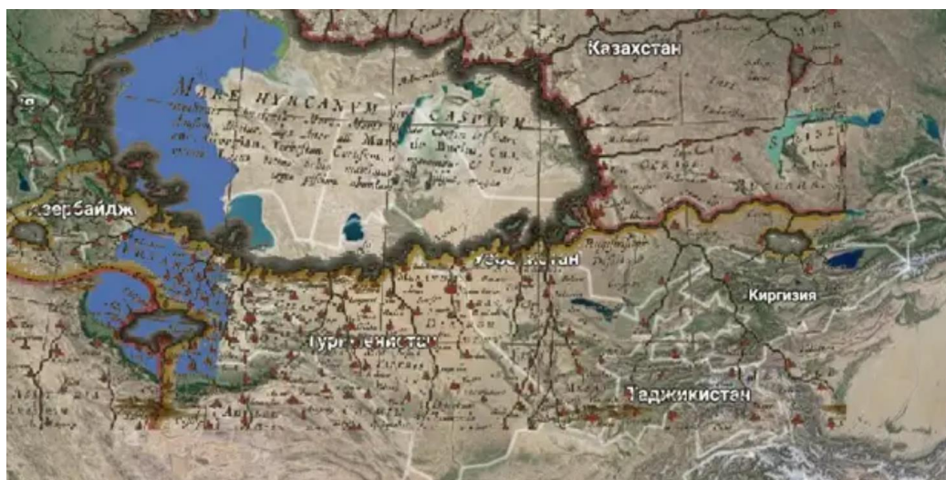
Карта Каспия до катаклизма, https://welemudr.mirtesen.ru/blog/43831556934/Katastrofyi-Drevnego-mira.-Kaspiyskoe-more---kak-eto-byilo.-Reko

Вот так, или примерно так выглядело Каспийское море во времена Контарини: