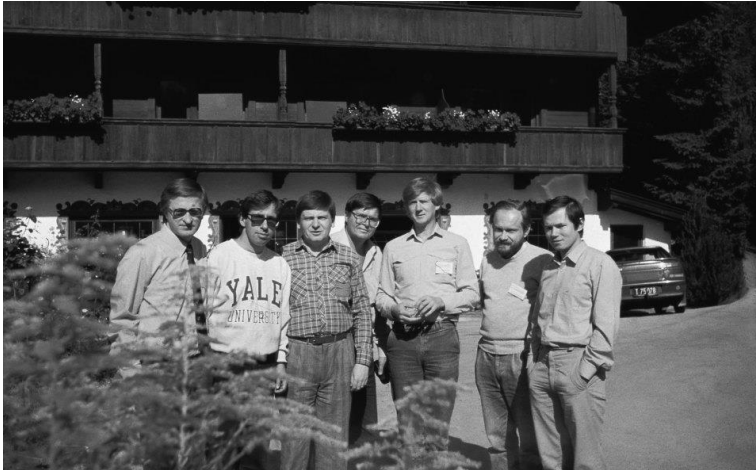
Знакомые всё лица: младореформаторы получают инструктаж в Западной Европе

У меня нет вопросов к ребятам на этой фотографии: их нашли, купили, «обласкали», дали каждому роль, и они честно отработали. Вопросы морали в таких ситуациях для таких людей — это «лирика».